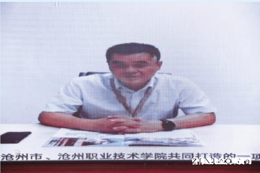
Z[ \ ] ^ _ ` a